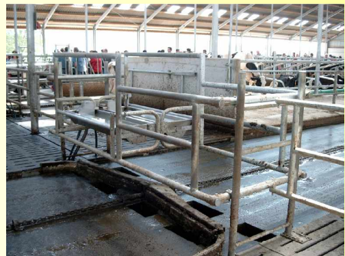
geteilte Abwurföffnungen mit Schutzgitter mit integrierten Tränken