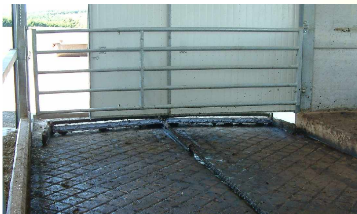
Klappschieber auf Rautenboden