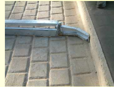
Seitliche Räumklappen mit Wischleisten

Die Klappschieber sind aus massivem Material hergestellt und komplett feuerverzinkt. Die Klappen sind mit abriebsfesten Wischleisten versehen. Durch die spezielle Konstruktion der Schieber mit einer geringen V-Form ist eine Führungsschiene in der Laufgangmitte nicht erforderlich. Die Klappschieber werden auf Betonboden, Rautenboden als auch auch auf Gummi-Laufgangbelägen eingesetzt.